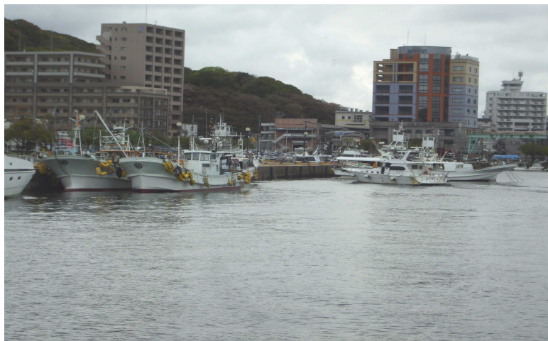
福岡県情緒障害教育研究会